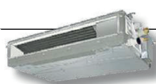
Gainable extra-plat Taille 0,3 CV (1 kW) Châssis compact Pompe de relevage