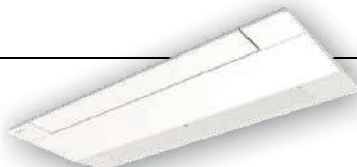
Diffuseur 1-voie Taille 0,3 CV (1 kW) Châssis compact (150 mm) Filtration avancée