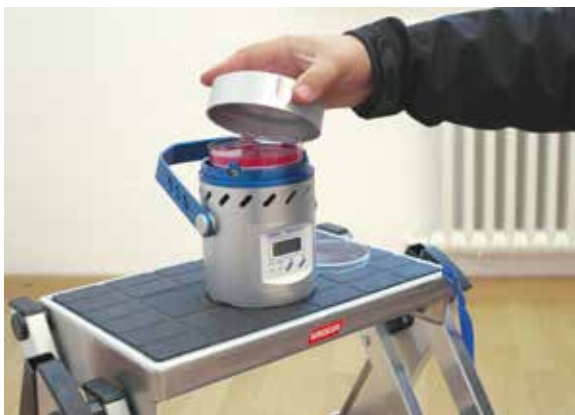
Luftkeimmessgerät für die Laborauswertung