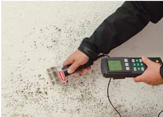
Mesure de l'humidité