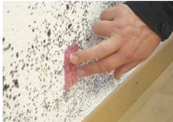
Prélèvement par empreinte