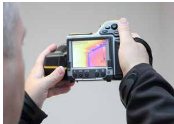
Analyse professionnelle des causes au moyen d'une caméra thermique