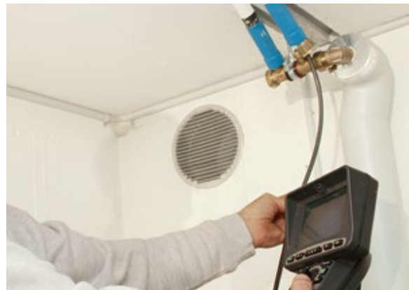
Kontrolle mit der Rohrkamera