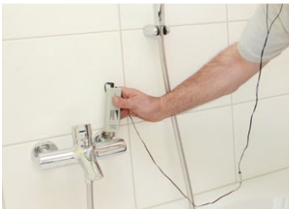
Kontrolle der Wassergeräusche (Leck-Pen)