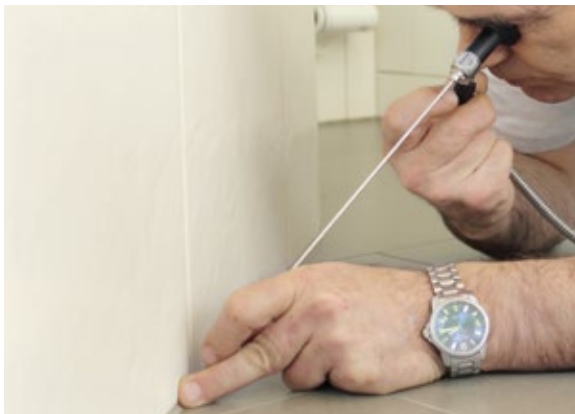
Kontrolle mit Endoskop