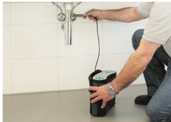
Lecksuche mit Wasserstoff (Tracergas)